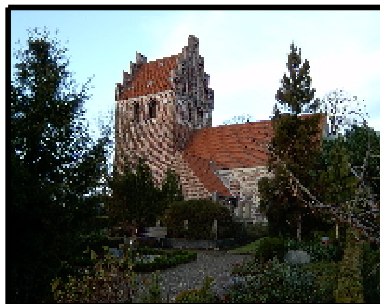
Kirke Værløse Kirke