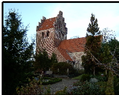
Kirke Værlose Kirke